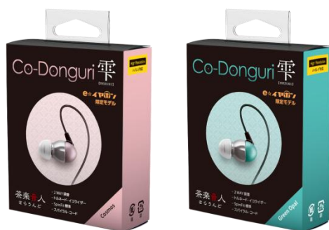
コスモス & グリーンオパール カラー : Cosmos & Green Opal