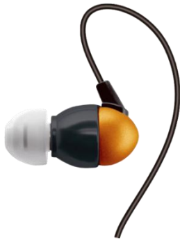
アンバーオレンジ カラー : Amber Orange